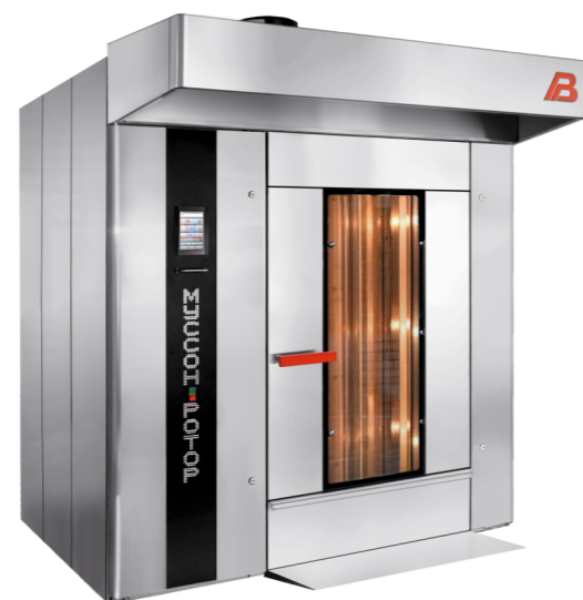
“Муссон ротор” модель 99М-01, 99М-02, 99MP-01, 99MP-02.