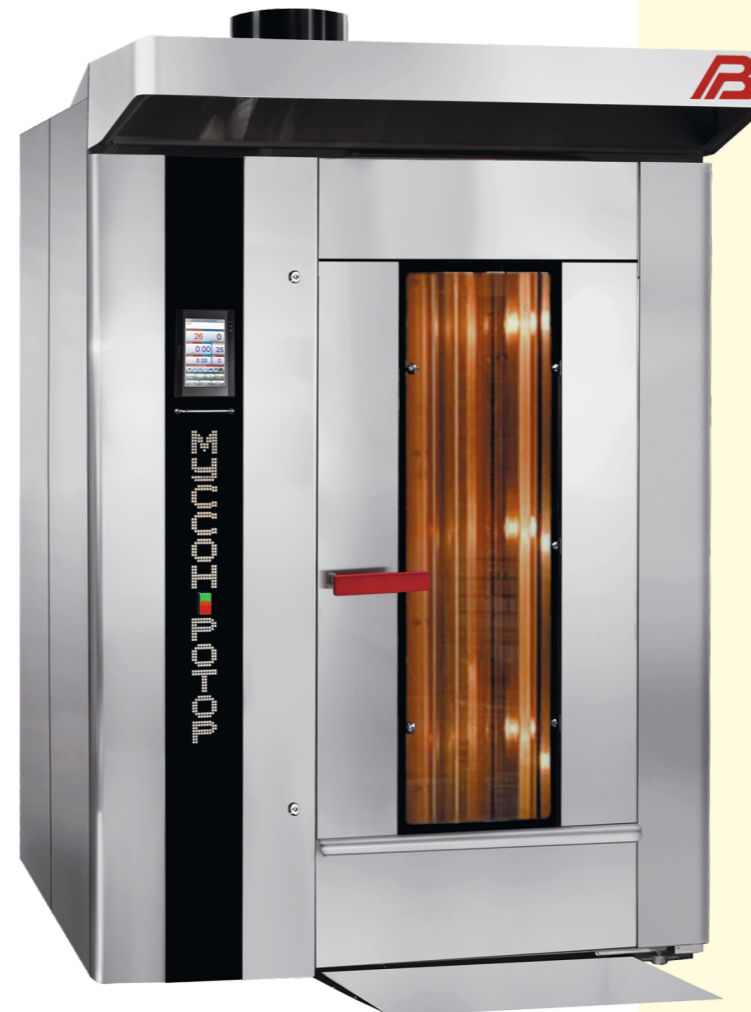
«Муссон-ротор» модель 55-01, 55-02, 55P-01, 55P-02

Multi-purpose rotary ovens (gas, liquid fuel, electric heating)