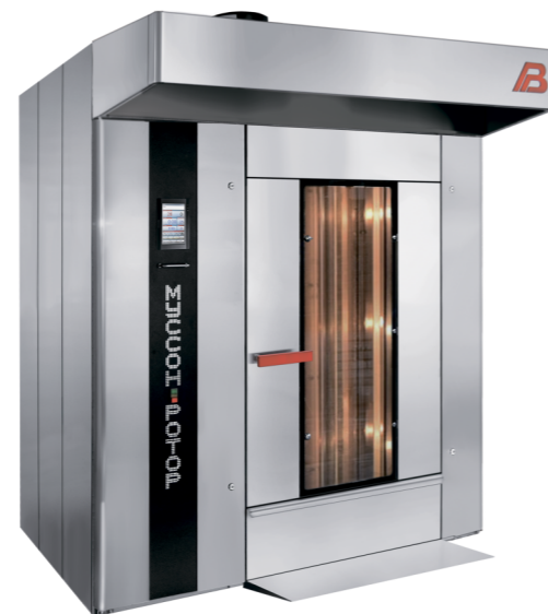
“Муссон ротор” модель 77М-01, 77М-02

- верхний привод вращения стеллажной тележки, передающий вращающий момент через рамку платформы, низкий порог пекарной камеры, короткий пандус, верхний узел фиксации тележки, запатентованный на территории РФ, упрощает закатывание тележки, позволяют избежать встряски тестовых заготовок при закатывании стеллажной тележки, исключают ее смещение во время выпечки