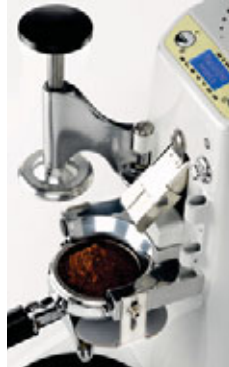
Pressa caffè brevettato Patented coffee tamper

Automatico, Alluminio Lucidato. Automatic, Polished Aluminium.