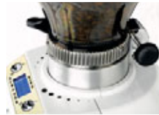
Regolazione micrometrica Micrometric adjustment