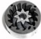
Macine Coniche Conical Mills