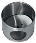
Wascheinsatz ohne Bürsten