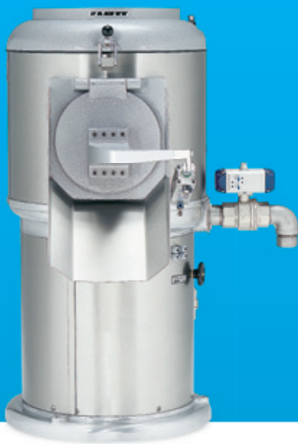
VAP 25 K