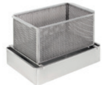
Schalenauffänger Edelstahl mit Stärkeabscheider

Jeweils auch mit Stärkeabscheider erhältlich