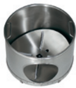
Wascheinsatz mit vier Bürsten