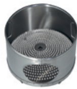
Wascheinsatz mit Bürsten